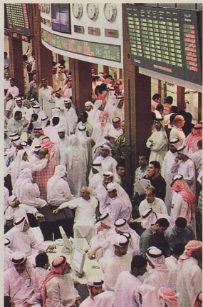
a これがごさわうドバイ証券取引所。2000年3月に開設されたばかりで、まだ歴史は浅い。

埼玉県ほどの広さしかないのに 世界一の飛行場、高層ビル群、 テーマパーク、屋内スキー場、 人工島、海中ホテルを次々建設中！