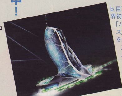
b 目下建築中、世界初の海中ホテル「ハイドロポリス」。c ヤシの木をかたどった人工島群「ザ・パーム」。d 世界最大の屋内人工スキー場「スキー・ドバイ」はすでに完成。砂漠の中だけに場内を冷やすのに2カ月もかかった。